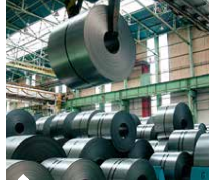
AB'nin çelik ürünleri ithalatı koruma önlemlerinden Türkiye 17 kategoride etkilendi.

AB tarafından yürütülen ve 1 Ekim 2019 itibarıyla tamamlanan gözden geçirme soruşturması neticesinde getirilen ilave kısıtlamalar Türkiye'nin ihracatını daha da olumsuz etkilemeye yönelik uygulamalar içerdi. Kararın Türkiye'ye yönelik olumsuz etkilerinin azaltılması için önlemin revize etmesi yönünde AB nezdinde gerçekleştirilen ikili girişimler sürdürülürken, Dünya Ticaret Örgütü nezdinde Türkiye'nin haklarının korunması için gerekli ilave adımların atılması kararlaştırıldı. Bu çerçevede 16 Mart itibarıyla söz konusu koruma önlemlerine