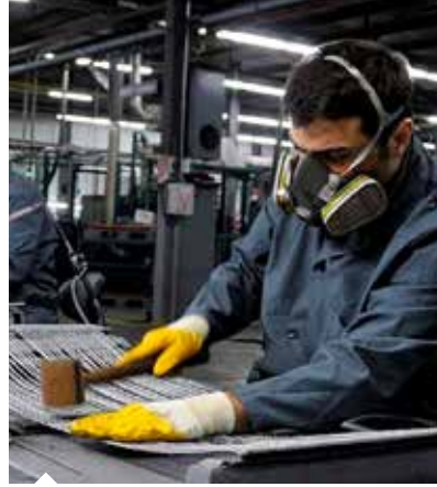
Koronavirüs salgını mart ayında Türk imalat sanayiinde aksamalara neden oldu.

EKONOMİK büyümenin öncü göstergelerinden İstanbul Sanayi Odası (İSO) Türkiye İmalat Satın Alma Yöneticileri Endeksi (PMI) koronavirüs salgınının ortaya çıkmasının ardından mart ayında 48,1'e gerileyerek, son üç ayda ilk kez eşik değeri olan 50,0'in altına indi. PMI verilerine göre, koronavirüs salgını mart ayında Türk imalat sektörlerinde aksamalara yol açtı ve sektörlerin çoğunda faaliyet koşullarının rekor düzeyde yavaşlamasına neden oldu.