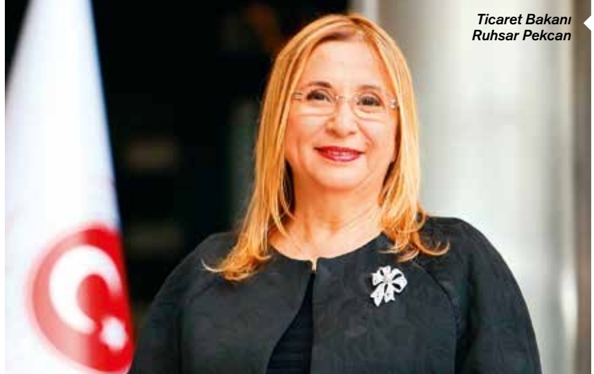
Ticaret Bakanı Ruhsar Pekcan

Mart ayı ihracatına ilişkin detaylara değinen Gülle, şu bilgileri verdi: "Türkiye ekonomisinin bugünü ve geleceği açısından vazgeçilmez bir sacayağı olduğu perçinlenmiş olan ihracatımıza yönelik farkındalığın ve TİM olarak ülkemizin her noktasında yürüttüğümüz KOBİ İhracat Seferberliği eğitimlerimizin en net sonucu olarak; mart ayında ihracat ailemize bin 335 firmamızın katıldığını bildirmekten memnuniyet duyuyorum. İhracata yeni başlayan bu firmalarımız mart ayında 61,3 milyon dolarlık ihracat gerçekleştirdi. Firma özelinde bakıldığında, mart ayı içerisinde toplam 35 bin 910 firmamız ihracat gerçekleştirdi. Bu dönemde gördük ki; maliyet olarak dezavantajlı olsak da bazı kilit ürünleri kendi imkanlarımızla kendi ülkemizde üretmemiz gerekiyor. İnanıyoruz ki bu dezavantaj, gerçekleştireceğimiz inovatif çalışmalarla beraber ortadan kalkacak ve yerli üretim "Dış Ticaret Fazlası Veren Türkiye" nin gerçekleşmesinde kilit rolü oynayacak."