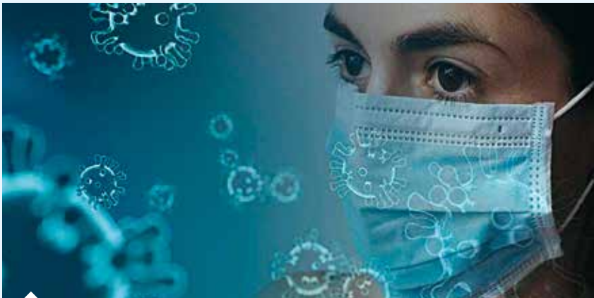
Maske, tulum, koruyucu önlük ve steril eldiven ihracatı ön izne bağlandı.

Son olarak solunum desteği ve entübasyona yönelik kullanılan bazı tıbbi cihaz ve sarf malzemelerinin ihracatı da ön izne bağlandı. Tebliğe eklenen maddeye göre tıp alanında kullanılan ventilatör, oksijen konsantratörü, ventilasyon sarf malzemeleri (flow sensör, ekspirasyon valfi, oksijen sensörü, ventilatör devreleri), hasta devreleri (anestezi/ventilatör devresi), kanül, entübasyon tüpleri ve yoğun bakım monitörleri de ihracı ön izne bağlı mallar listesine eklendi. Bu ürünlerin ihracatı için Türkiye Tıbbi İlaç ve Tıbbi Cihaz Kurumundan izin alınması gerektiği bildirildi.