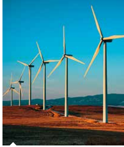
Türkiye'de son 10 yılda rüzgar enerjisi santrali sayısı 198'e ulaştı.

Türkiye Rüzgâr Enerjisi Birliği'nin (TÜREB) 2019 yılına ilişkin "Rüzgâr Enerjisi