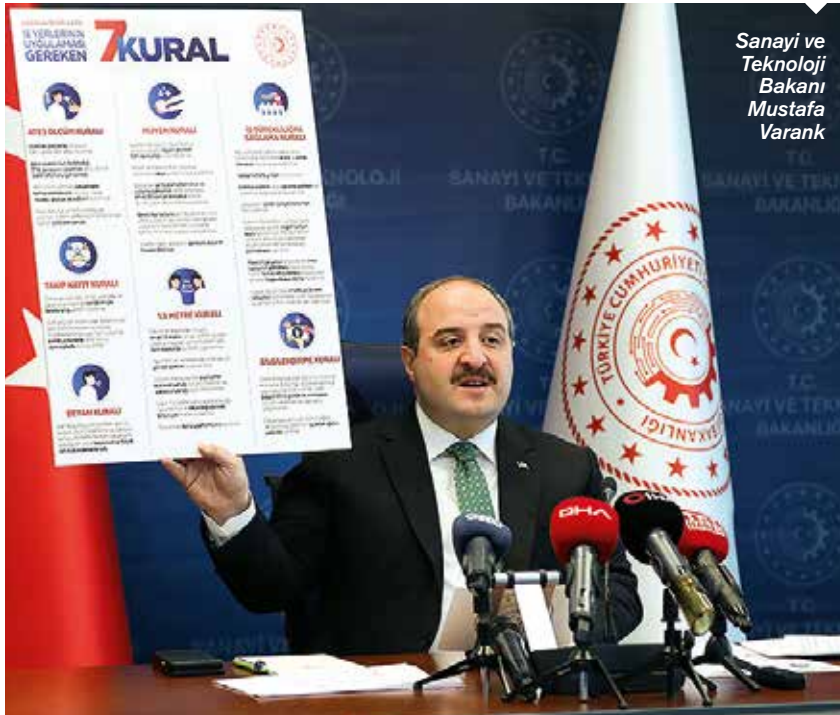
Sanayi ve Teknoloji Bakanı Mustafa Varank

KOSGEB'in çeşitli programları aracılığıyla proje bazlı destekler sunduğunu, bunun yanı sıra girişimcileri desteklediğini kaydeden Bakan Varank, şu ifadeleri kullandı: "Proje süresi yükümlülüklerini ya da girişimcilik programı yükümlülüklerini 11 Mart 2020 ve sonrasında yerine getirmesi gereken işletmelere, 4 aya kadar ek zaman vereceğiz. Böylece projeler kesintiye uğramamış olacak."