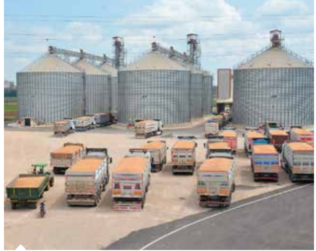
Ülke genelindeki lisanslı depolarda 20 çeşit ürün muhafaza ediliyor.

Toprak Mahsulleri Ofisi (TMO) Genel Müdürü Ahmet Güldal ise kurumun 1993 yılından itibaren uyguladığı emanet alım sistemi ile temellerini attığı Lisanslı Depoculuk sisteminde son verileri paylaşırken, günümüzde 4 milyon 700 bin ton kapasiteye ulaştığını belirtti. Türkiye'de 91 firma tarafından 128 noktada lisanslı depoculuk faaliyetinin yürütüldüğünü aktaran Güldal, "Kurumumuz 2016 yılından beri ülkemizde kapalı depo açığının giderilmesini, ürünlerin daha sağlıklı koşullarda depolanmasını,