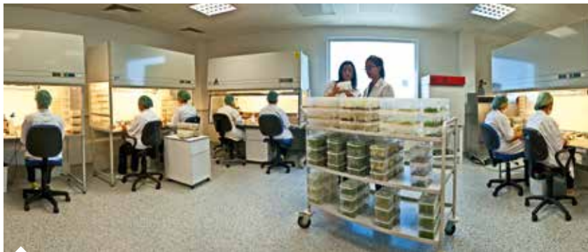
Tekfen Tarım Agripark'ta hastalıklardan ari, kaliteli tohum ve fidan üretimi yapılıyor.

2004 yılından beri biyoteknolojik tarımsal üretim ve araştırma faaliyetlerinin yürüttüğü Tekfen Tarım Agripark Ar-Ge Merkezi'nde doku kültürü ve moleküler biyoteknoloji laboratuvarları, seralar, soğuk hava deposu, tarla bitkileri proses ve depolama üniteleri yer alıyor. Hastalıklardan ari, kaliteli tohum ve fidan üretimi yapan Tekfen Tarım, özellikle muz ve patates üretiminde elde ettiği başarıyı diğer tür ve çeşitlerin üretimine yansıtmayı hedefliyor. Anadolu'nun zengin biyoçeşitliliğinin kaynak olarak değerlendirildiği merkezde, Türk tarımının geleceğine yönelik önemli çalışmalar yürütülüyor.